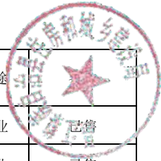
和悦家园商铺情况一览表